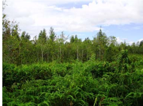
Photo hutan muda