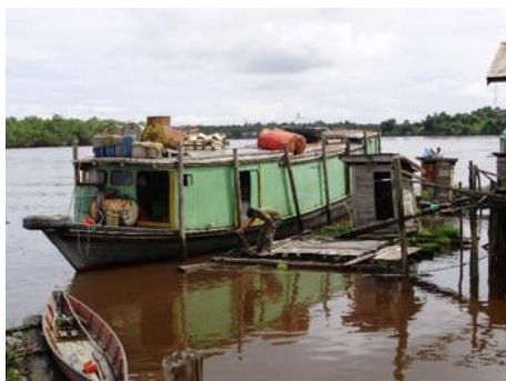
Photo sungai dengan kapal dagang