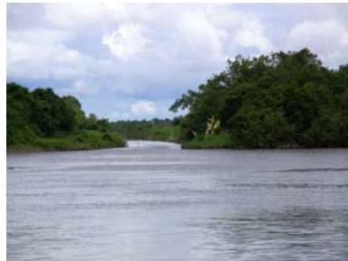
gambar Pukung Pahewan